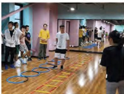
学生完成理实一体课程学习

本专业培养具有良好职业道德和人文素质，全面掌握儿童体智能项目规划与训练、儿童体育教育心理、儿童及青少年体育社会学和体育技术所需要的基本理论、基本技能和基本方法，了解儿童青少年运动场馆运营、教培门店管理等常识，具备从事儿童青少年运动测评、训练、儿童青少年运动项目推广的高素质体育技能型人才。