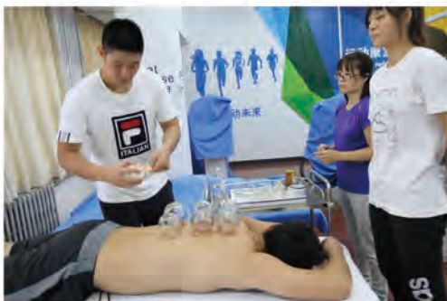
中医传统 治疗技术实操课