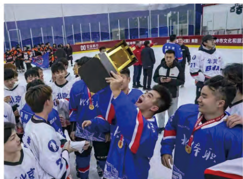
北京体育职业学院冰球队 在颁奖仪式后庆祝