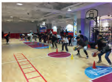
学生体验企业课程

本专业毕业生将依托于我院体育行业办学的资源优势，在儿童少年运动馆、篮球专项俱乐部、早教培训机构、幼儿园、儿童青少年运动赛事组织机构等相关企事业单位从事少儿运动场馆运营管理、少儿运动课程教练、课程培训导师、客服接待、少儿运动成长顾问、少儿运动培训组织、少儿运动赛事运营、少儿运动市场营销、门店管理、体育网红达人内容创作等岗位工作。