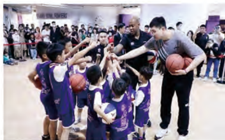
学生参与企业活动