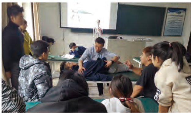
运动拉伸技术实操课