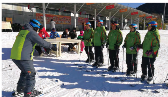
考取滑雪国家职业资格证书的培训