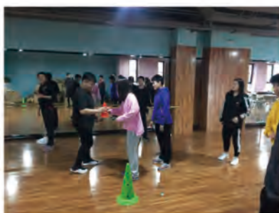
儿童青少年体育游戏创编课程课堂教学