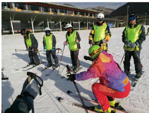
快乐激情的滑雪实训课

本专业毕业生将依托于我院体育行业办学的资源优势，在冰雪场馆、冰雪运动俱乐部、冰雪运动培训机构、冰雪运动赛事组织机构、冰雪运动装备、体育旅游等相关企事业单位从事冰雪场馆运营与管理、冰雪基本技术指导、冰雪运动安全防护与救助、