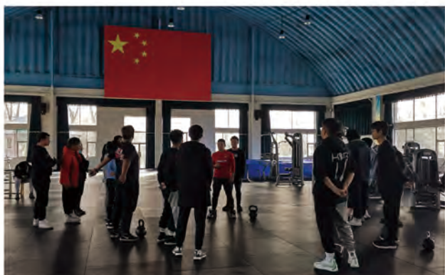
功能训练技术实操课