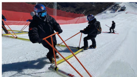
学生在国家高山滑雪中心的岗位实践

学习期间，本专业学生将完成社会体育指导员（滑雪、滑冰）证书、中国冰球E级教练员证书、冰球裁判员证书等相关职业资格证书课程的学习（取证费用自理）。