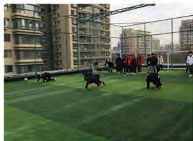
学生体验企业课程