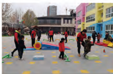
学生在实习实训场地授课