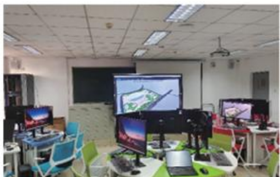
体育场馆运营管理虚拟仿真教室