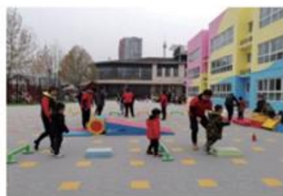
学生在实习实训场地授课