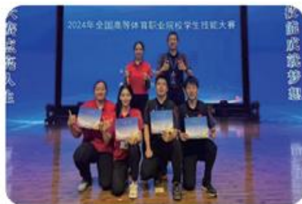
师生参与技能大赛齐获奖