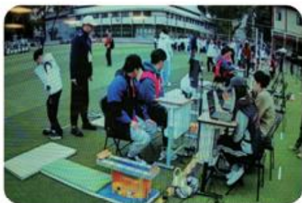
学生参加小学生体质测试实践服务