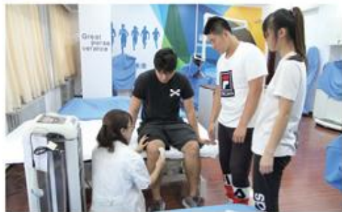
物理治疗技术实操课

培养掌握运动人体科学、运动营养、运动康复、运动生理学和运动解剖学等相关知识；具备康复评定技术、运动康复技术、中医传统疗法、特殊人群康复等理论和实践技能，能从事健身指导、运动伤害防护、康复治疗等工作的创新型、高素质技能型人才。