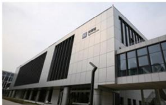
大兴机场教育科研基地体育馆