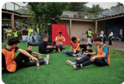
学生入企指导儿童运动