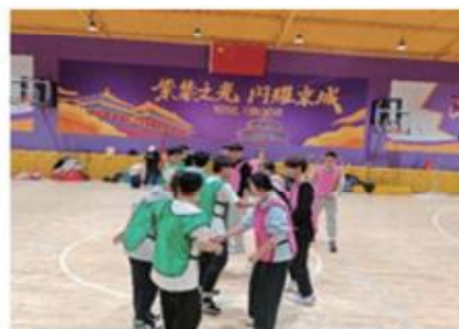
学生体验企业课程

可在儿童青少年运动馆、专项俱乐部、早教培训机构、幼儿园、儿童青少年运动赛事组织机构等相关企事业单位从事儿童青少年运动指导、课外体育课程设计与实施、体育活动设计与实施、儿童青少年运动赛事运营、儿童青少年运动场馆运营管理等工作。