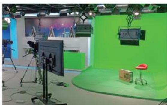
体育新媒体实训教室